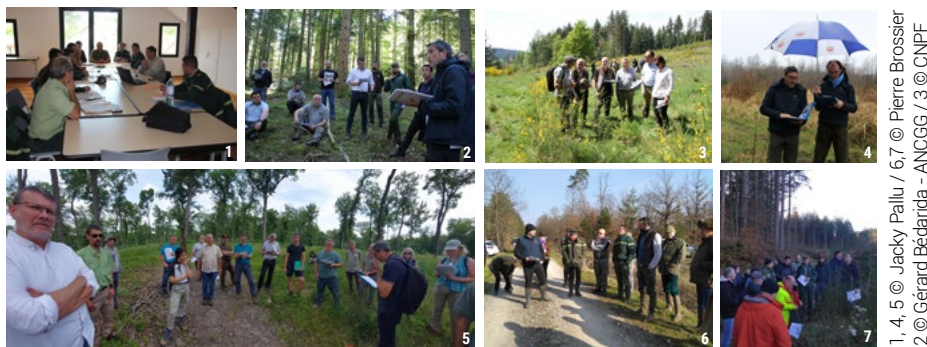
1, 4, 5 © Jacky Pallu / 6,7 © Pierre Brossier 2 © Gérard Bedard - ANCGG / 3 © CNPF

Avec l'aide des deux ministères, le Ministère de l'Agriculture et de l'Alimentation (MAA) et le Ministère de la Transition Écologique (MET), lors de la 1 ère convention 2021-2023, nous avons réalisé 52 formations auprès de plus de 1300 personnes sur toute la France. Un webinaire a été co-organisé avec le Comité des Forêts, la Fondation François Sommer, l'Office National des Forêts (ONF) et le domaine du Bois Landry. Sa version en ligne comptabilise plus de 5300 connexions. ( https://www.youtube.com/watch?v=K3KadiPoy3Q )