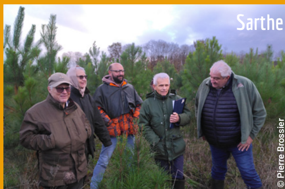
Les 6 et 12 novembre 2024 à Château-l'Hermitage et Oizé en Sarthe (72)