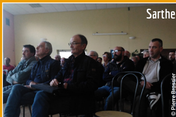
Le 11 octobre 2024 à Yvré-le-Polin en Sarthe (72)