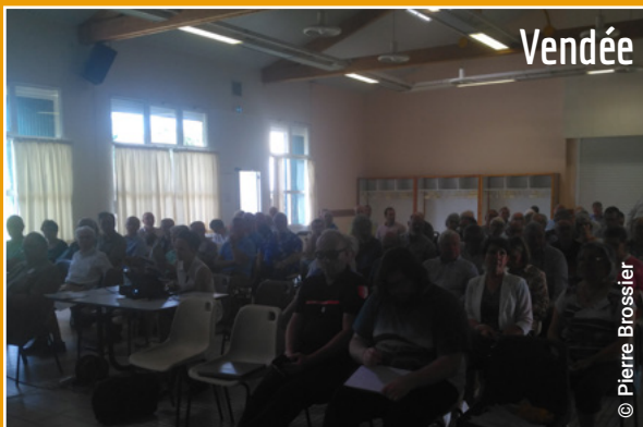
Le 30 juillet 2024 lors de l'Assemblée Générale du syndicat forestier Fransylva 85 à Aubigny en Vendée (85)