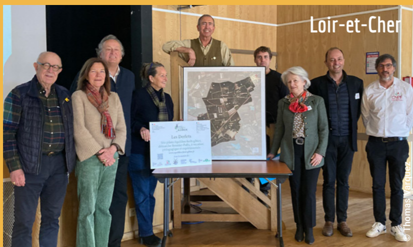
Le 14 mars 2025 en Forêt des Derlets (305 ha) à Yvoy-le-Marron dans le Loir-et-Cher (41).