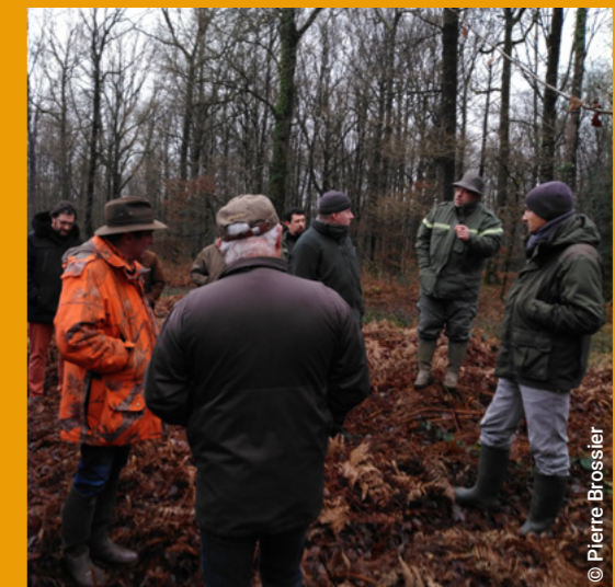
Le 11 décembre 2024, formation de terrain pour le réseau