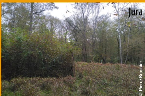
Le 24 octobre 2024 en Forêt Domaniale de Chauv dans le Jura (39).